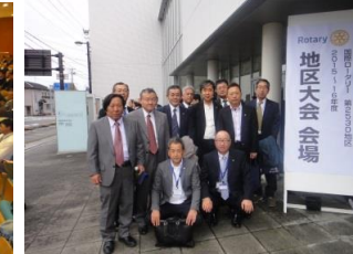
参加者で集合写真