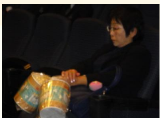
菱沼会員遠くから有難うございます。