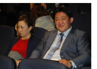
福島南ロータリーのこうちゃん、ご参加有難うございます。