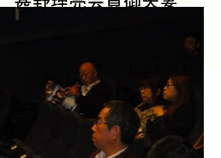
さすが、こばちゃん、暗がりでもカメラ目線です。