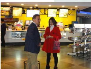
なんでこんな所に来たんだよ。だって、私寂しかったの