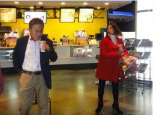
俺は、帰るぜ。え！待って〜〜。